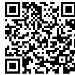
游於藝網站使用說明影